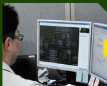
プリント基板設計